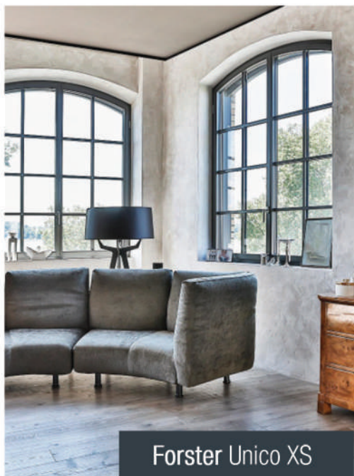
Forster Unico XS